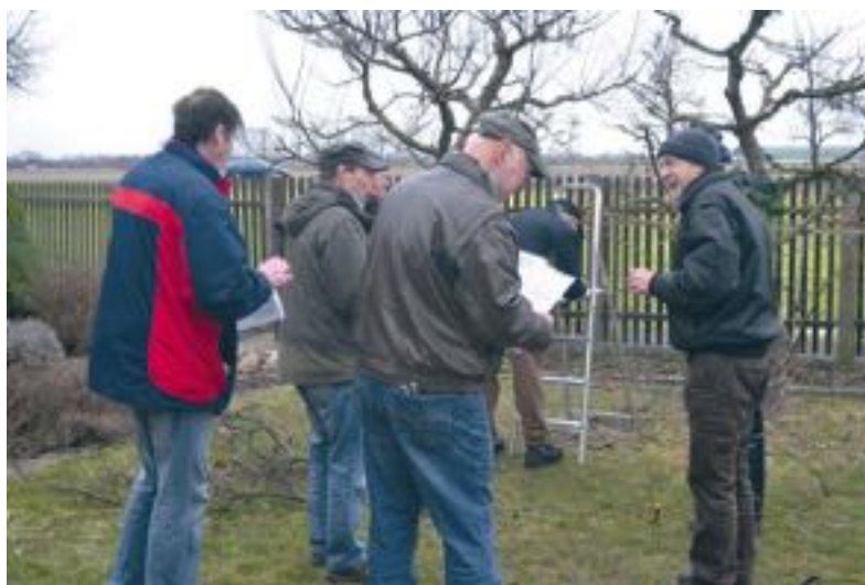
Ab sofort sind Anmeldungen zur Tages-schulung „Gehölzschnitt“ des Kreisverbandes möglich.

Nach einer Stärkung geht es am Nachmittag mit der Praxis weiter. Die Teilnehmer schneiden selbst und werden durch die Fachberater nur unterstützt, denn die Erfahrung hat gezeigt: Nur wenn man wirklich schneidet, wird das erworbene Wissen gefestigt. Aus diesem Grund muss jeder Teilnehmer