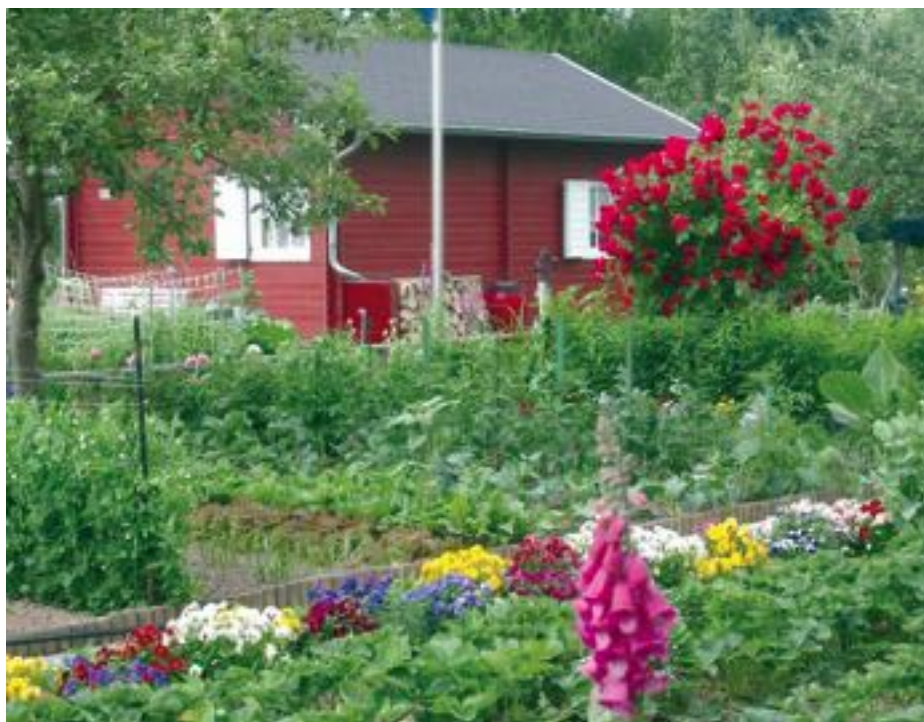
Die Beliebtheit der Kleingärten spiegelt sich im vergangenen Jahr auch im wachsenden Medieninteresse wider.