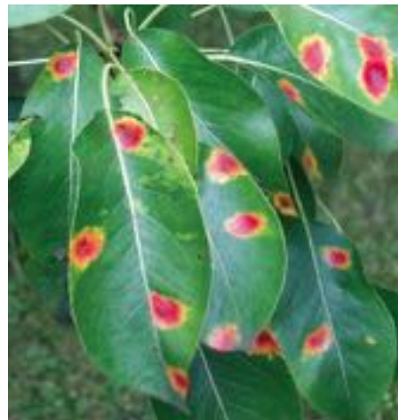
Typisches Schadbild des Birnengitterrosts.

Die Behandlung der Obstbäume gegen Pilzkrankheiten ist äußerst wichtig. In der ersten Entwicklungsphase der Blätter ist permanent mit Infektionen zu rechnen. Die Behandlung umfasst Vorblüten-, Blüten- und Nachblütenspritzung. Aus meinen Erfahrungen empfehle ich „Neudo-Vital Obst-Spritzmittel“ gegen Birnengitterrost, Schorf am Apfel, Kräuselkrankheit und Monilia Spitzendürre.