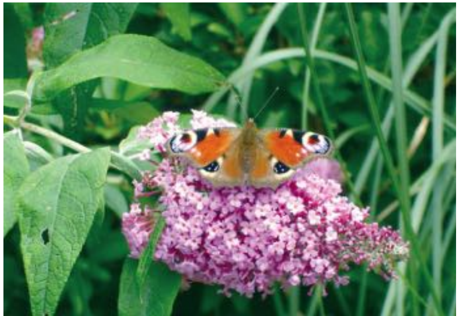
An den Blüten des Schmetterlingsfliers tun sich zahlreiche Tagfalter, aber auch Honigbienen, Hummeln und Holzbienen göttlich.

Nach dem Rückschnitt sollte der Boden mit organischem Dünger nachgebessert werden. Angeboten werden die Pflanzen im Handel von Früh-