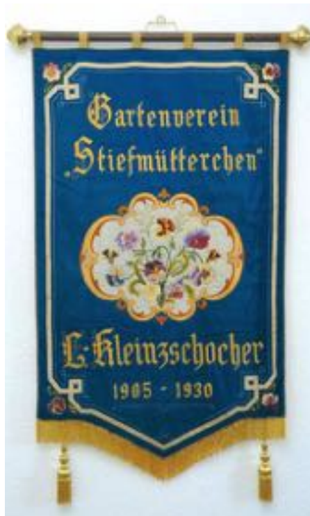
Der Gartenverein „Stiefmütterchen“ e.V. musste 1976 dem Wohnungsbau weichen. Seine erhaltene Fahne zeigt die namensgebenden Blumen.

So ist der Legende nach das Stiefmütterchen in der Lage, Herzen zu heilen. Es ist sogar möglich sich wieder zu verlieben – wie romantisch. In der Blumensprache steht das Stiefmütterchen als das Sinnbild für Erin-