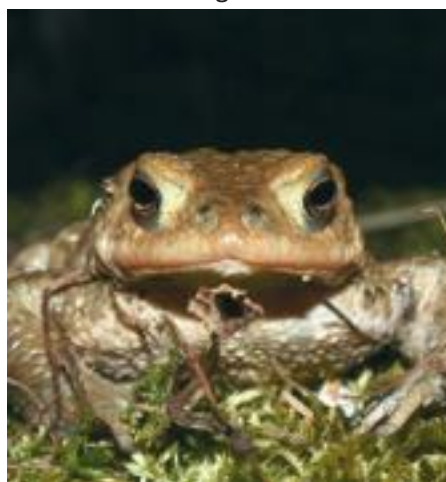
Fühlen Nützlinge wie diese Erdkröte sich im Garten wohl, haben's Schädlinge nicht leicht.

Neben der Chance, für den Eigenbedarf gesundes, frisches Obst und Gemüse ohne Gift heranziehen, hat der Kleingärtner die Möglichkeit, einen Ausschnitt der Natur bewusst zu erleben. Auch die Kinder genießen so die Vielfalt der Natur, erleben das Wachstum vom Samenkorn bis zur großen Sonnenblume und freuen sich an Eidechsen, Bienen, Igel, Vögeln und Schmetterlingen.