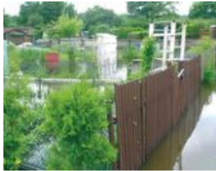
Ansteigendes Grundwasser in der Anlage des KGV „Brandts Aue“.

Doch das ist (nicht nur aus Kostengründen) nicht überall möglich. Viele Kleingartenanlagen wurden seinerzeit auf Flächen angelegt, die für Baumaßnahmen ungeeignet waren (z.B. Außen). Die Folge sind Überschwemmungen und Vernässungen, z.B. durch ansteigendes Grundwasser, hohe Gewässerpegel sowie ungenügend gewartete Abflusanlagen.