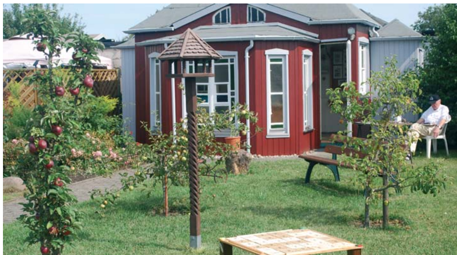
Museumsgarten in der Kleingartenanlage „Am Kärrnerweg“.

Schon jetzt stoßen die Erholungsmöglichkeiten in der Natur an ihre Grenzen und die Möglichkeiten der Stadt für eine Erweiterung der Areale sind sehr begrenzt. Dazu kommt, dass die aktuell zur Verfügung stehenden Erholungsbereiche oft großen Belastungen durch das Verhalten einzelner Bürger ausgesetzt sind. So wer-