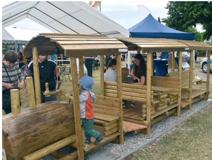
Durch den Stadtverband finanziell geförderte Kindereisenbahn in der Kleingartenanlage „Gartenfreunde Südost“.

Die Stadtverwaltung sowie die beiden Leipziger Kleingärtnerverbände fördern solche Aktivitäten finanziell.