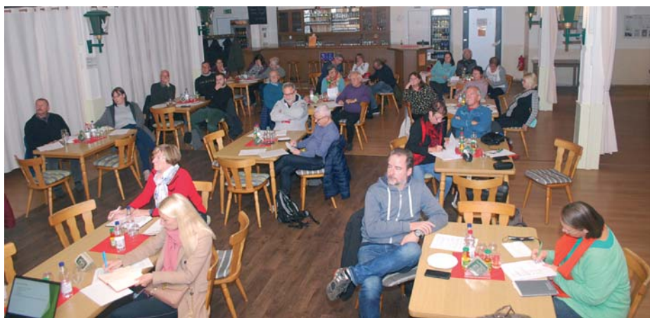
Rückblick: Finanzschulung „auf Lücke“ unter Coronaregeln.

Deswegen sollten die Vereine darüber nachdenken, ob und wie bestimmte Erfahrungen weiterhin genutzt werden könnten. Dafür wären allerdings entsprechende Satzungsregelungen notwendig. Eine Satzung ist kein unumstößliches Dokument, sie kann den neuen Erfordernissen entsprechend gestaltet und beschlossen werden. Rechtsanwalt Karsten