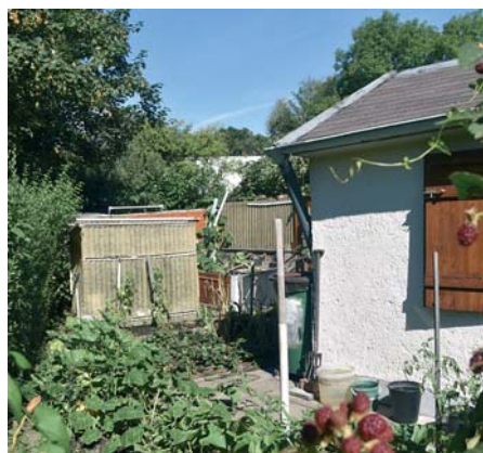
Naturnah gestaltete Parzelle.

eins. Die gewählten Vorstände wurden zu Vereinsführungen und die Vorsitzenden zu Vereinsführern umfunktioniert. Die eingangs beschriebene Angliederung der kleineren Vereine wurde verfügt und meist gegen deren Willen vollzogen. Pflichtveranstaltungen fanden statt. Bei Nichtteilnahme drohte die Kündigung des Pachtverhältnisses.