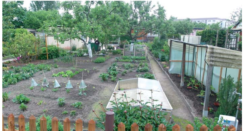
Die kleingärtnerische Nutzung ist deutlich sichtbar.

Die „Omas for Future“ möchten einen gesellschaftlichen Bewusstseinswandel erzeugen, indem sie eine positive und lebenswerte nachhaltige