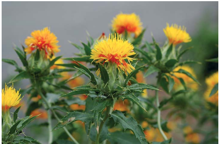
Die Färberdistel ist ein Blickfang im Garten.

Für den Anbau im Kleingarten ist unbedingt ein sonniger und warmer Standort zu wählen. Damit die Färberdistel gut gedeiht und ihre volle Blütenpracht entwickelt, wird das Saatgut in lehmig-sandiger Erde kultiviert. Der Boden sollte pH-neutral und gut durchlässig sein. Staunässe ist unbedingt zu vermeiden. Trockene, mager-