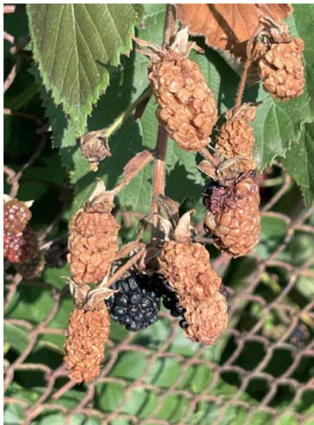
Auch Pflanzen bekommen Sonnenbrand.

Nicht nur die Haut von uns Kleingärtnern leidet, sofern sie ungeschützt über zu lange Zeit der Sonne ausgesetzt ist. Sonnenbrand kann auch bei