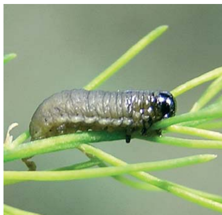
Die Larven des Spargelhähnchens sollten abgesammelt werden, denn im kommenden Frühjahr fressen sie die Jungpflanzen weg.

Alternativ können Sie den Boden im Herbst und Frühling auch mit Tomatenblättersud begießen. Dazu einfach