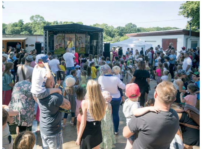
Mitglieder und Gäste erlebten eine rundum gelungene Jubiläumsfeier mit vielen Attraktionen.